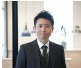
フラワートライアルジャパン実行委員長 (株式会社ハクサン 常務取締役)