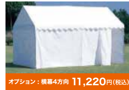
オプション：横幕4方向 11,220円(税込)