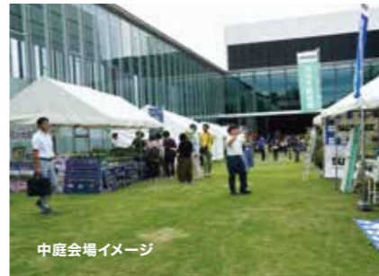
中庭会場イメージ

テント小間料：1小間(幅5.4×奥行3.6m)=54,500円(税込) 1小間増ごと=38,000円(税込)