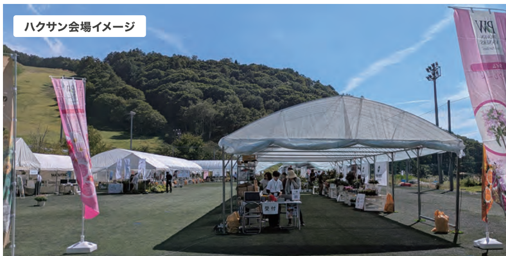
ハクサン会場イメージ