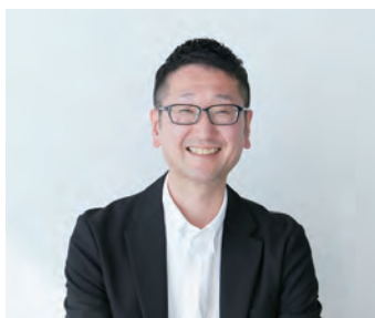
フラワートライアルジャパン実行委員長 (MPS ジャパン株式会社)